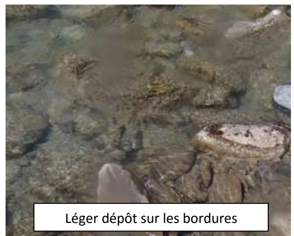
Léger dépôt sur les bordures