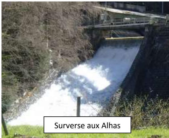
Surverse aux Alhas

Sur les bordures le fond est propre en surface, mais dès qu'on remue le substrat de nombreuses matières fines s'en échappent.