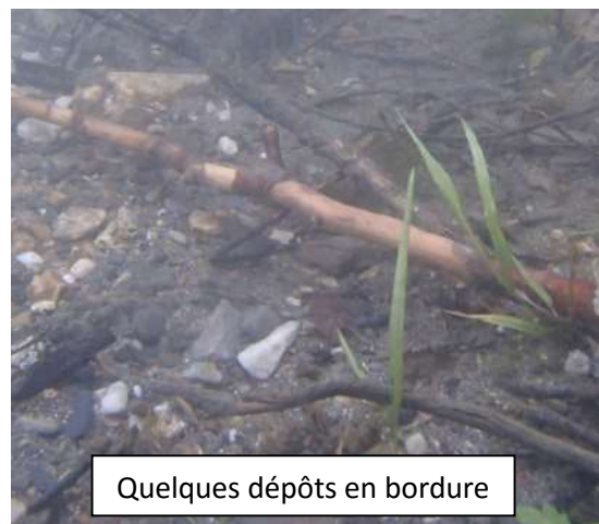
Quelques dépôts en bordure