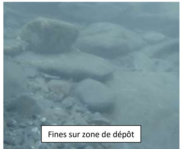
Fines sur zone de dépôt