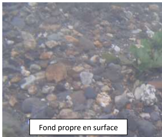
Fond propre en surface