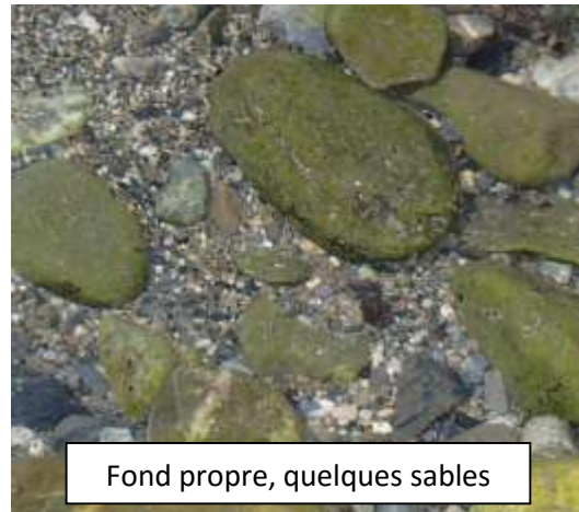
Fond propre, quelques sables