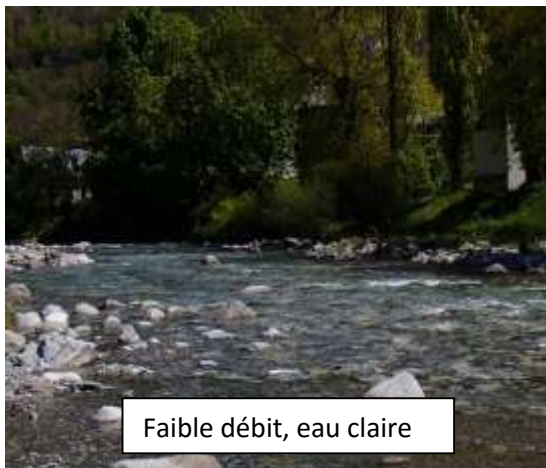
Faible débit, eau claire

Nombreux alevins de truite fario, tout juste émergents, sur les bordures.