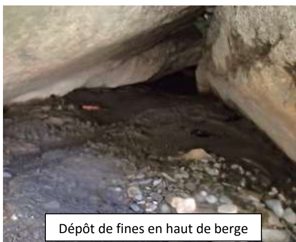
Dépôt de fines en haut de berge