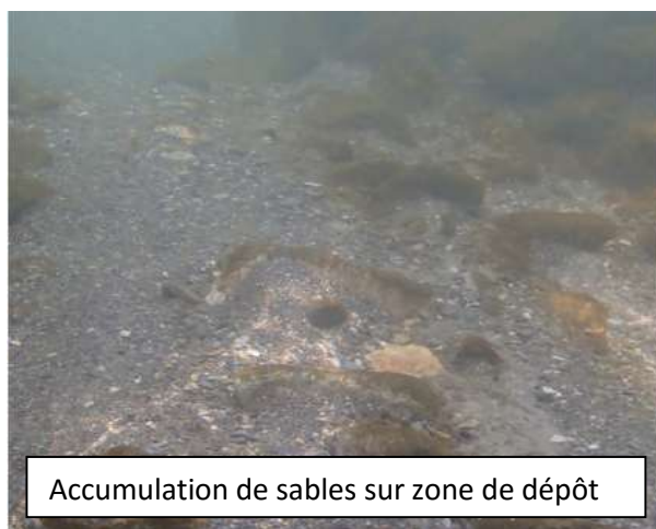
Accumulation de sables sur zone de dépôt