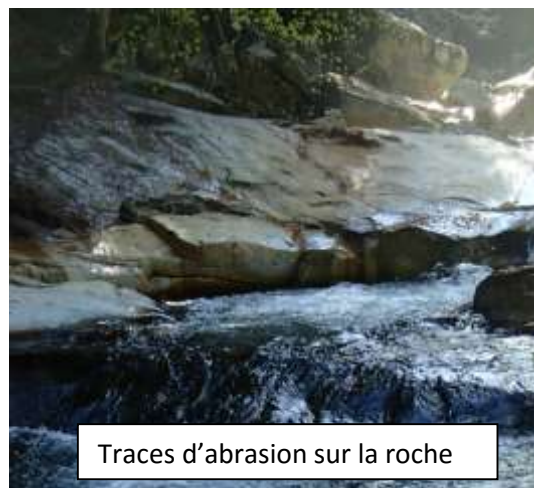
Traces d'abrasion sur la roche