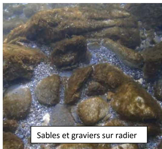
Sables et graviers sur radier