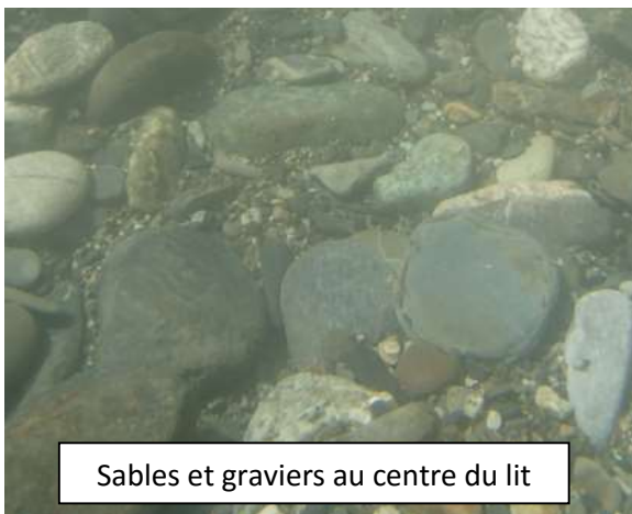
Sables et graviers au centre du lit